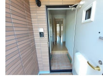
その他部屋・スペース