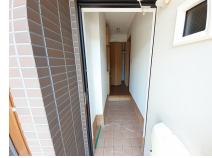
その他部屋・スペース