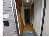
その他部屋・スペース