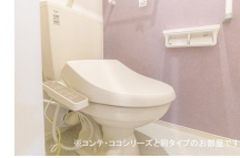
その他部屋・スペース