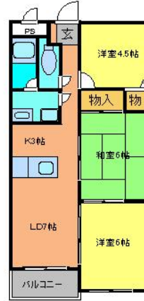
間取り図は現況を優先します。