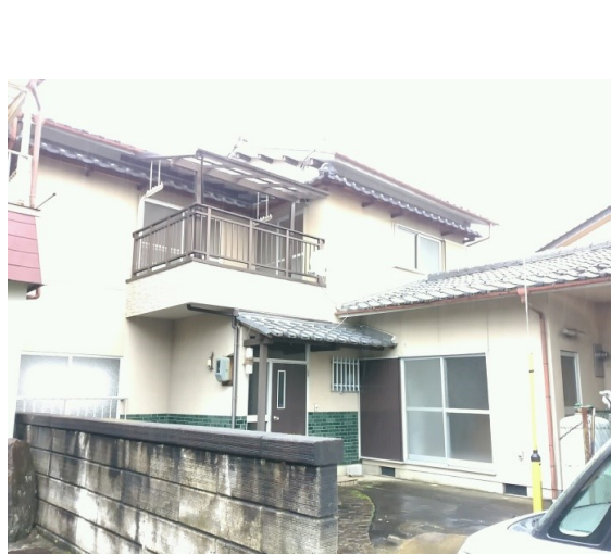
* 進入道路から見る