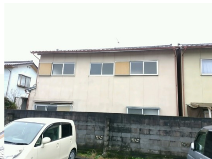
* 三ツ丸ストアから見る