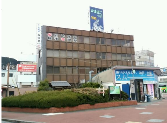
第1西矢殖産ビル 1階～4階(共通)